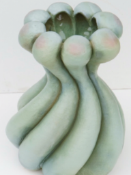
Lea Greger, Belobigung 2025