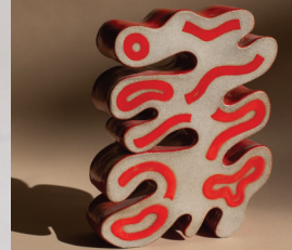
Isabella Bambagioni, Belobigung 2025