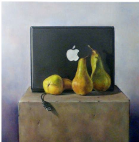
Dieter Hagen | Veräppelt | Öl auf Leinwand | 2016. © (Dieter Hagen) VG Bild-Kunst Bonn, 2017

Anlässlich des 70-jährigen Bestehens des Bund Bildender Künstlerinnen und Künstler der Landesgruppe Oldenburg präsentiert das Stadtmuseum unter dem Titel „Taufrisch“ eine Jubiläumsausstellung, die das ganze Spektrum des gegenwärtigen Kunstschaffens der Mitglieder vereint. Eine unabhängige Jury hat 94 aktuelle Werke von 79 Künstlerinnen und Künstlern aus den Bereichen Malerei, Grafik, Fotografie, Objekte und Skulpturen ausgewählt. Bei der Ausschreibung gab es keine inhaltlichen oder formalen künstlerischen Kriterien wie die