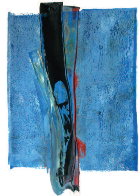
Johannes Cernota | Invention Flagranti II | Gouache auf Karton | 2017