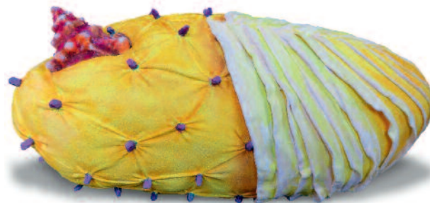
Gabriele Böger | Drachengeburt II | Aquarell auf Baumwolle, genäht | 2017 © (Gabriele Böger) VG Bild-Kunst Bonn, 2017

Vorgabe von Stilrichtungen oder Techniken. Als einzige Maßgabe galt, dass das Werk – taufrisch – in den Jahren 2016 oder 2017 entstanden sein sollte. Und so liegt der besondere Reiz der Ausstellung in der Zusammenschau der Werke, die eindrucksvoll die vielfältigen Ausdrucksformen, Themen und Materialien der lokalspezifischen Kunstlandschaft dokumentiert. Zudem wird auch überraschenden Wechselbeziehungen Raum gegeben, die der Betrachter für sich entdecken kann. Das Spektrum der Werke reicht von farbgewaltigen Acrylbildern, über phantasievolle Stoffobjekte bis hin zu faszinierenden Glasskulpturen und gesellschaftspolitischen Grafiken. Jedes Kunstwerk in der Jubiläumsausstellung erzählt eine ganz eigene Geschichte, die zahlreiche Möglichkeiten der Begegnung, des Perspektivwechsels und der Empathie eröffnen. Sie sind herzlich eingeladen, sich auf diese Dialoge einzulassen!