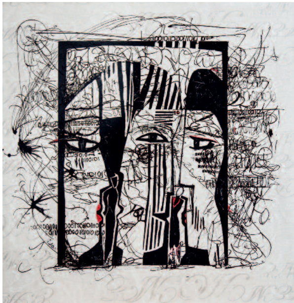
Ida Oelke | Kommunikation | Holzschnitt, Tusche auf Leinwand | 2016. © (Ida Oelke) VG Bild-Kunst Bonn, 2017

Anlässlich des 70-jährigen Bestehens des Bund Bildender Künstlerinnen und Künstler der Landesgruppe Oldenburg präsentiert das Stadtmuseum unter dem Titel „Taufrisch“ eine Jubiläumsausstellung, die das ganze Spektrum des gegenwärtigen Kunstschaffens der Mitglieder vereint. Eine unabhängige Jury hat 94 aktuelle Werke von 79 Künstlerinnen und Künstlern aus den Bereichen Malerei, Grafik, Fotografie, Objekte und Skulpturen ausgewählt. Bei der Ausschreibung gab es keine inhaltlichen oder formalen künstlerischen Kriterien wie die