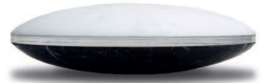
Petra Hemken | Bilico I | Marmor, Acryl | 2016